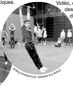
Cirque à la verticale