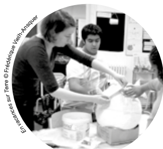
En vacances sur Terre

En utilisant des matériaux olfactifs et comestibles avec l'artiste Sabrina Vitali, les élèves de Dominique Duarte et d'Olivier Gondrand sollicitent le goût et l'odorat afin de stimuler leur créativité de manière originale. À l'Onde, ils mettent en scène leurs créations éphémères dans des décors réalisés collectivement. Dans le cadre d'un PEAC, avec le soutien de l'école Rabourdin